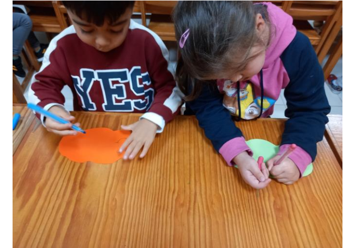
Plenamente "As nuvens das emoções" Semana: 02 a 06 de novembro