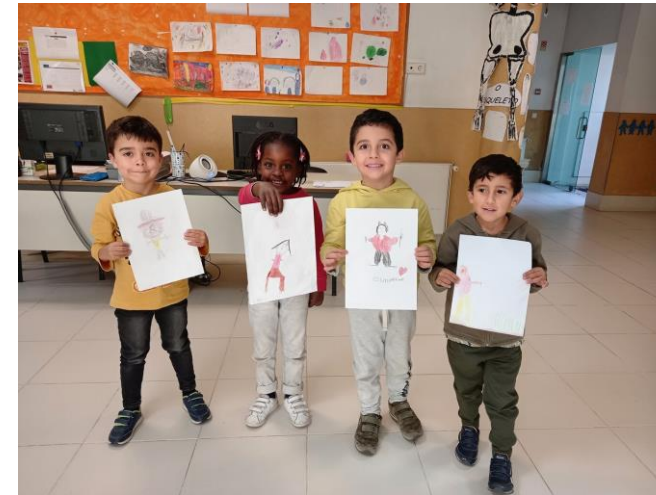
Play English "My Body" Semana: 12 a 16 de outubro