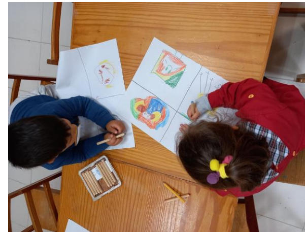
Faz & Conta "O Cuquedo em BD" Semana: 19 a 23 de outubro