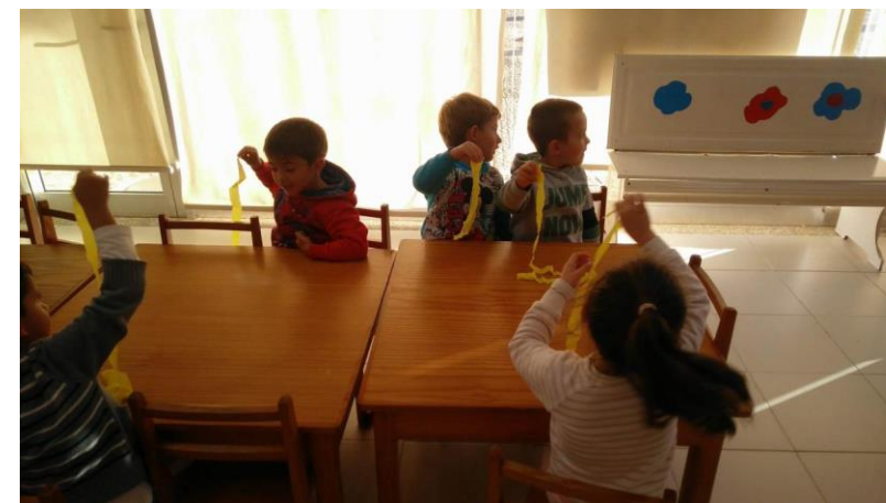
Sons & Sentidos "Ritmo & Cor" Semana: 26 a 30 de outubro