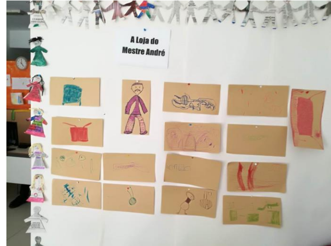
Sons & Sentidos "A loja do Mestre André" Semana: 21 a 25 de setembro