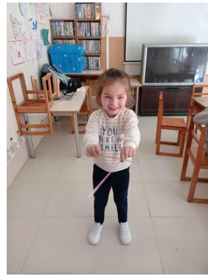
Sons & Sentidos "A Batuta" Semana: 28 de setembro a 02 de outubro