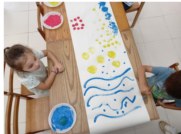
Cria & Explora "Carimbagem" Semana: 14 a 18 de setembro