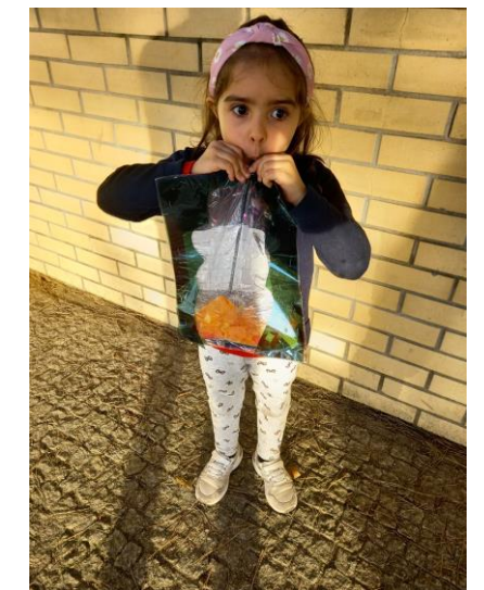
Cria & Explora "Fogueira de São Martinho" Semana: 09 a 13 de novembro