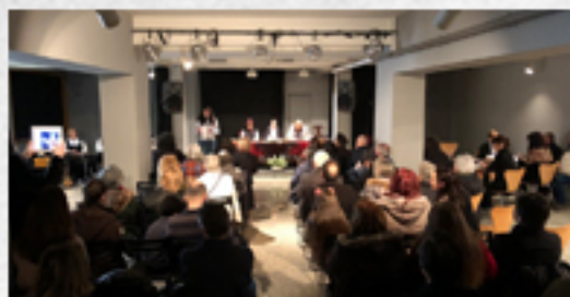
15 16H00 TERTÚLIA "ASAS DE POESIA" CAFÉ CONCERTO CENTR'ARTE