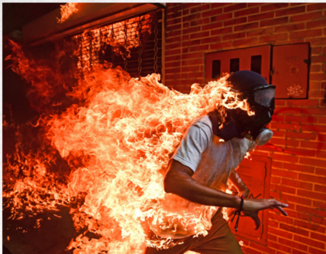
01 E 02 EXPOSIÇÃO "WORLD PRESS PHOTO 2018"