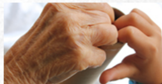
03 A 28 EXPOSIÇÃO "COLORIR A VIDA - O PROJETO SOCIAL, CRÓNICAS E FEITOS, DE UMA PRESENÇA SOCIAL"