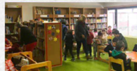
04 A 28 VISITA "VEM CONHECER A TUA BIBLIOTECA"