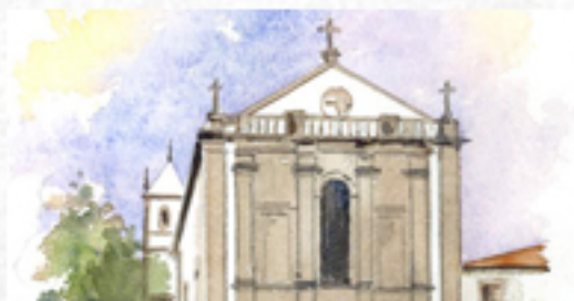
03 a 29 EXPOSIÇÃO "CADERNOS DO MOSTEIRO"