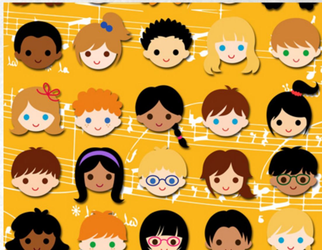
01 MÚSICA V ENCONTRO DE COROS INFANTIS