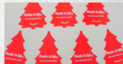
28 09H30 EXPOSIÇÃO "MADE IN MAIA" MAIA WELCOME CENTER