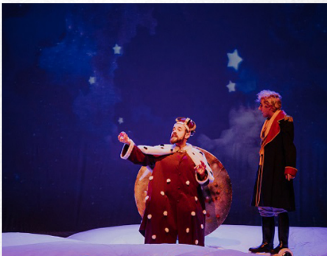
22 16H00 E 18H00 MUSICAL "O PRINCEPEZINHO" FÓRUM DA MAIA