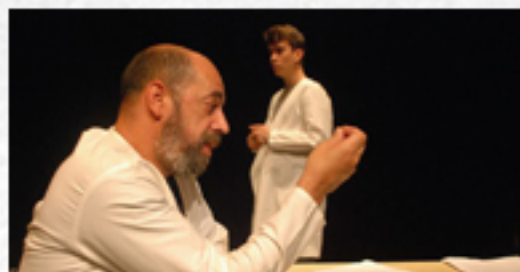
18 a 22 TEATRO "ARMAZENADOS" TEATRO ART'IMAGEM AUDITÓRIO DA QUINTA DA CAVERNEIRA