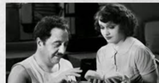
22 21H30 CINECLUBE DA MAIA "A MULHER DO PADEIRA" DE MARCEL PAGNOL AUDITÓRIO VENEPOR