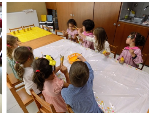
Pintar a alegria