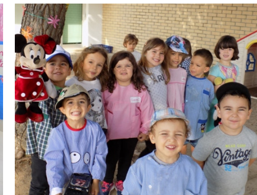
Rodeados de amigos