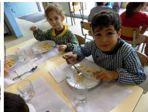
Hora do almoço