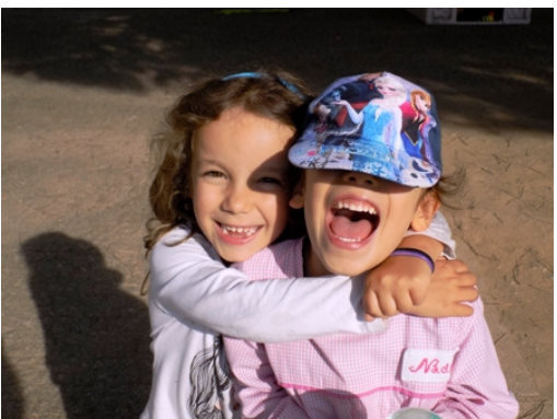
Amizade para uma vida