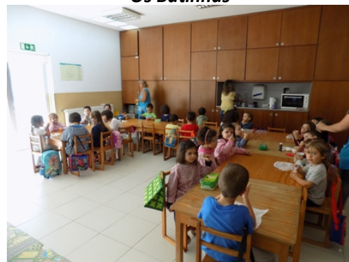
A deliciosa hora do lanche