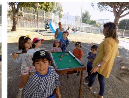
Jogar com os colegas e com os adultos