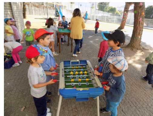
Jogar com os colegas