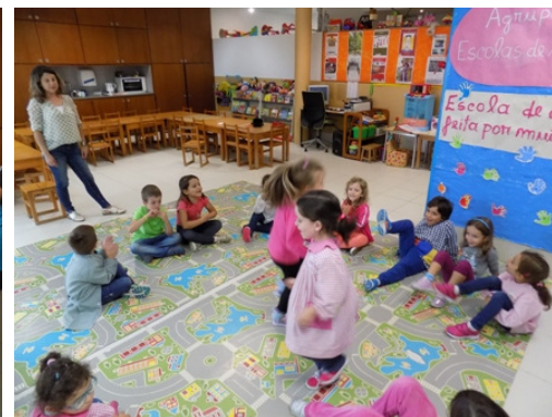
Aprender a brincar e brincar a aprender