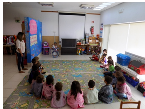
Casting para a nova formação da banda "Os Batinhas"