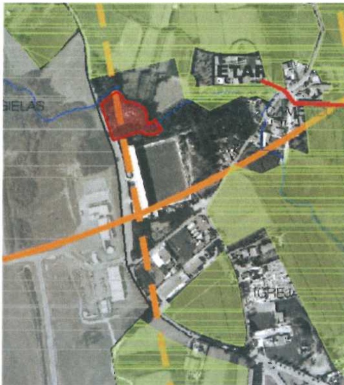
Figura 5. Extrato da Planta de Condicionantes - Síntese