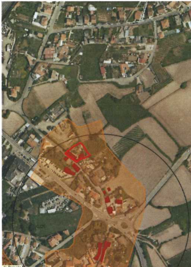
Figura 2. Extrato da Planta de Ordenamento – Património Edificado

No que se refere às servidões e restrições de utilidade pública identificadas na Planta de Condicionantes sobre a área em questão, apenas recai a zona 7 da servidão aeronáutica do Aeroporto Francisco Sá Carneiro, conforme imagem infra, que não coloca quaisquer condicionamentos à edificação e uso pretendidos.