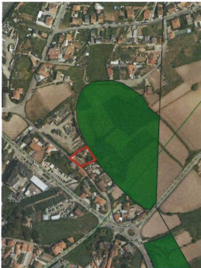
Figura 3. Extrato da Planta de Condicionantes - Síntese