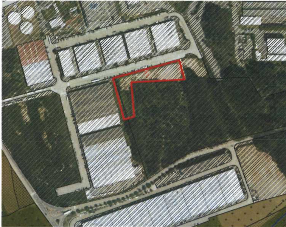
Figura 6. Extrato da Planta de Ordenamento – Qualificação Funcional do Solo

No que se refere às servidões e restrições de utilidade pública identificadas na Planta de Condicionantes sobre a área em questão, apenas recai a zona 5 da servidão aeronáutica do Aeroporto Francisco Sá Carneiro, conforme imagem infra, que não coloca quaisquer condicionamentos à edificação e uso pretendidos.