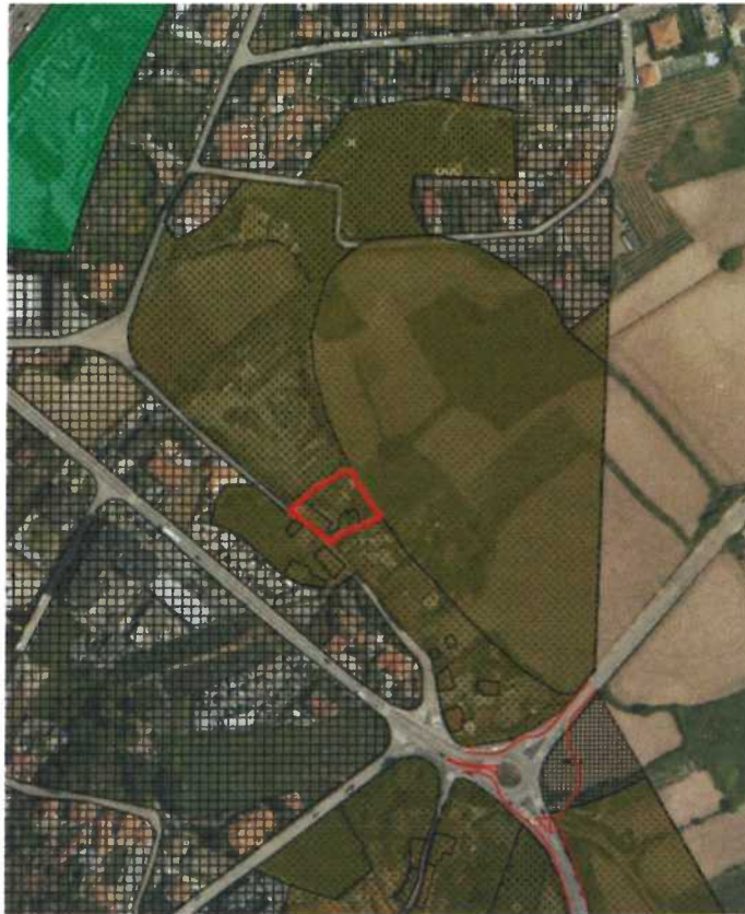
Figura 1. Extrato da Planta de Ordenamento – Qualificação Funcional do Solo