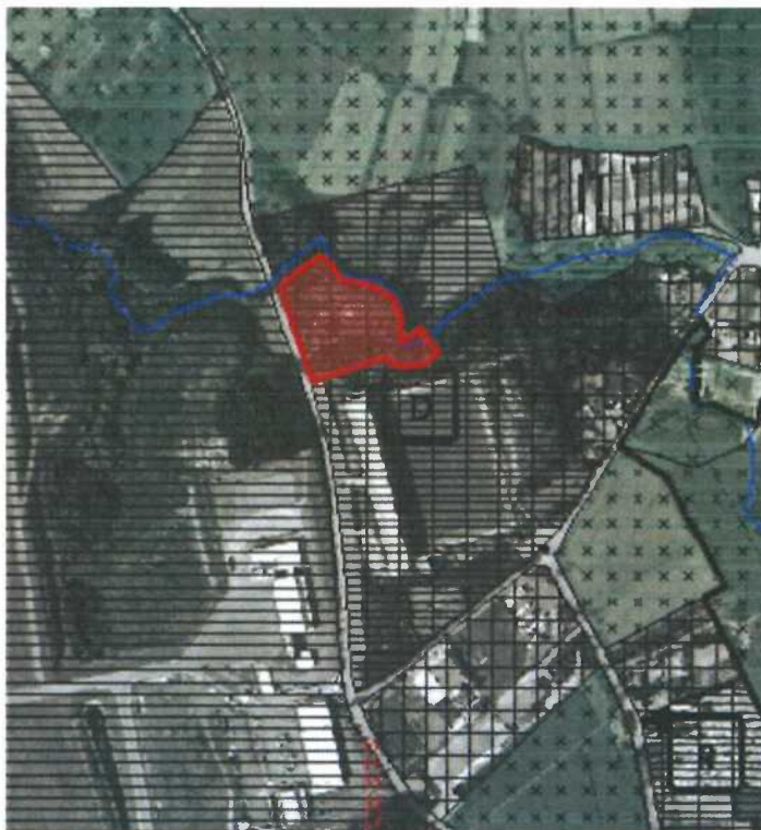
Figura 4. Extrato da Planta de Ordenamento – Qualificação Funcional do Solo

No que se refere às servidões e restrições de utilidade pública identificadas na Planta de Condicionantes sobre a área em questão apenas recai a zona 1, 2 e 2VOR da servidão aeronáutica do Aeroporto Francisco Sá Carneiro, conforme imagem infra. Neste caso, carece de parecer junto da ANAC, sendo que já foi confirmada tecnicamente a viabilidade de construção do projeto em desenvolvimento, em termos de cêrcea máxima para as novas construções (dois pisos), bem como ao nível do cumprimento das normas de ruído.