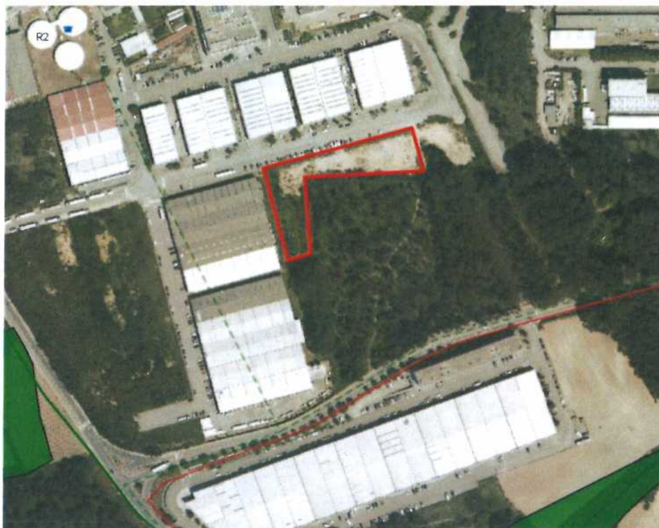
Figura 7. Extrato da Planta de Condicionantes - Síntese

Mais se informa que, nos últimos quatro anos, as áreas sobre as quais incide a suspensão e as medidas preventivas não foram objeto de medidas cautelares, conforme dispõe o n.º 5 do art.º 141.º do RJIGT.